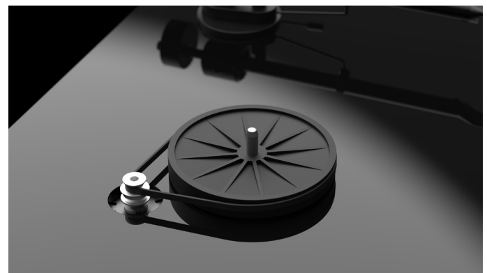
Besonders präzise Motor- und Subteller-Konstruktion

Der Plattenteller des T1 wird per Riemen angetrieben. Dieser überträgt präzise die Antriebskraft auf den neu designten Subteller, welcher wiederum in dem ultra-präzisen 0,001mm Plattentellerlager mit einem gehärtetem Edelstahlschaft in einer Messingbuchse sitzt; genau wie in unseren bewährten Essential III Modellen. Damit bietet der T1 - neben seinem laufruhigen Motor - eine stabile und resonanzarme Plattform für Tonarm und Tonabnehmer.