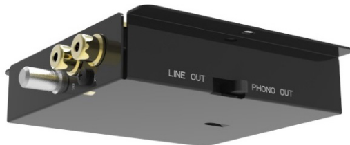
Integrierter Phono-Vorverstärker Umschaltbar zwischen Phono und Line Level Ausgang

Der T1 von Pro-Ject Audio Systems ist der erste Plattenspieler der T-Line, der für wenig Geld bereits echte HiFi Klangqualität liefert. Dieser glänzt mit hochwertigen Materialien, einem stylischen Aussehen und einem unglaublich lebendigen Sound. Während des umfangreichen Entwicklungsprozesses wurde akribisch darauf geachtet, dass trotz des unglaublichen Preises keine Kompromisse in Sachen Klangqualität gemacht werden. Im Vergleich zum Standard T1-Model, verfügt die Phono SB Version über einen integrierten, von Pro-Ject entwickelten, hochqualitativen MM Phono-Vorverstärker und eine elektronische Geschwindigkeitsumschaltung zwischen 33 und 45 RPM.