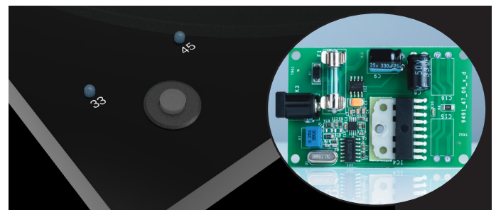
Elektronische Geschwindigkeitsumschaltung zw. 33/45 RPM DC/AC Motorsteuerung für genauen und präzisen Antrieb

Wobei viele andere Plattenspieler unregelmäßige Gleichstrommotoren mit massiven Gleichlaufschwankungen eingebaut haben, verfügt der T1 Phono SB über unseren etablierten, elektronisch geregelten, präzisen Wechselstrommotor. Der T1 Phono SB hat darüber hinaus eine elektronische Geschwindigkeitsumschaltung zwischen 33 und 45 RPM. Dieses System garantiert einen geräuscharmen, stabilen Antrieb des Plattenspielers.