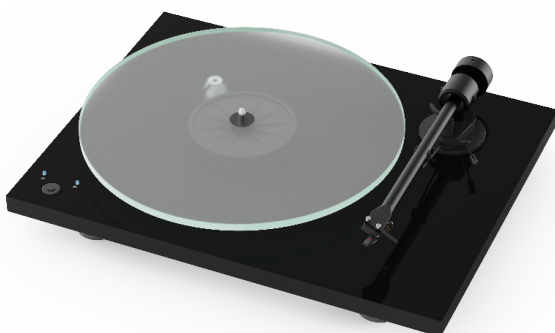
Ausgezeichnete Verarbeitung, stylisches Aussehen und audiophiler Klang; Präzisionsgefertigtes Gehäuse und schwerer resonanzarmer Glasplattenteller

Das stylische, CNC gefräste Chassis, in Hochglanz Schwarz, matt Weiß & Walnuss erhältlich, enthält keinerlei Plastikteile und wird gänzlich ohne Hohlräume gefertigt, sodass keine unerwünschten Vibrationen im Chassis auftreten können.