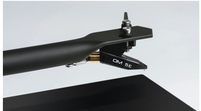
Hochqualitativer Ortofon OM 5E MM Tonabnehmer mit elliptischem Stylus

Darüber hinaus wird der T1 nicht - wie oft üblich - nur mit einfachen Cinch Kabel ausgeliefert. Im Lieferumfang sind nämlich hervorragend abgeschirmte, quasi-symmetrische, niederkapazitive Phono Kabel, welche von Pro-Ject speziell für den Anschluss von Plattenspielern konzipiert wurden, enthalten. Zudem befindet sich auch eine Staubschutzhaube, für zusätzlichen Schutz des T1 und eine Filzmatte, die als weiche Auflagefläche für Ihre Platten dient, im Paket.