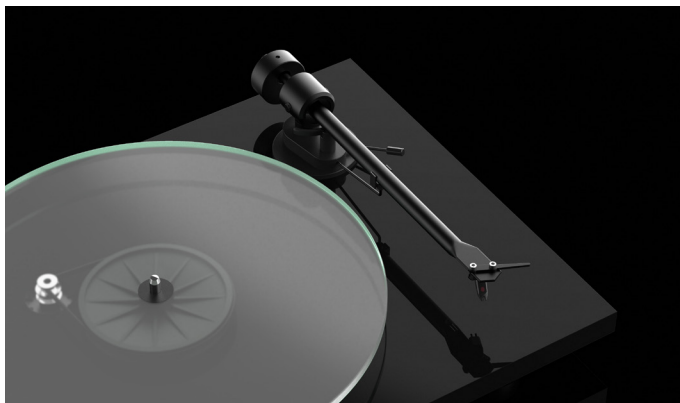
Einteiliger Aluminiumtonarm Robuste und steife Konstruktion für glasklaren Sound

Der vormontierte Ortofon OM 5E Qualitäts-Tonabnehmer mit elliptischem Nadelschliff macht diesen Plattenspieler zum einem echten HiFi Wiedergabegerät ohne Kompromisse.