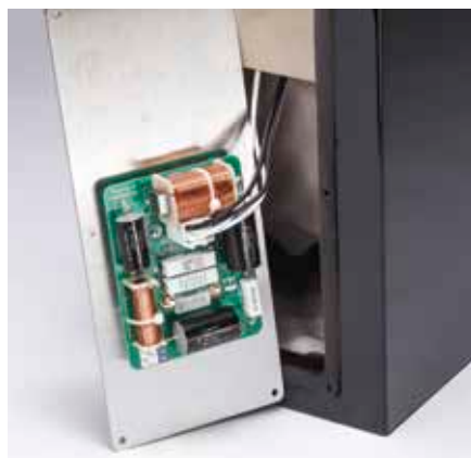
▲ Große Klappen hinten eignen sich naturgemäß perfekt für die „Aktivierung“ von Lautsprechern.

Stunden einspielen“, so lautete die Mahnung des Vertriebs. Tatsächlich genossen fairerweise alle vier Paare, der Einfachheit halber in Reihe geschaltet, in etwa diese