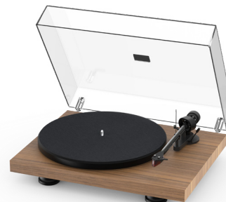
Satin Echtholz Walnuss Furnier